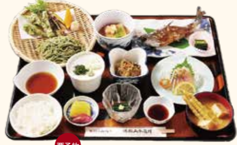
要予約 仙人膳 2,420円(税込)