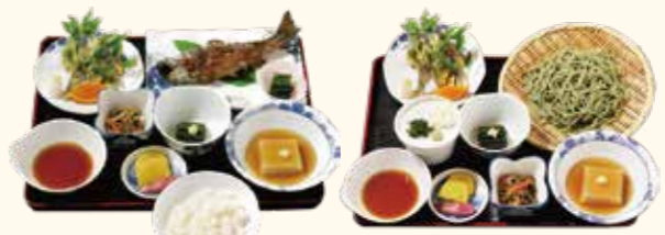
御沢膳 1,760円(税込) よもぎ麦きり膳 1,760円(税込)