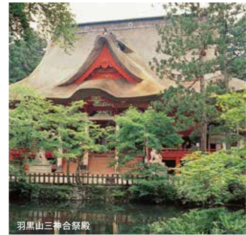
羽黒山三神合祭殿