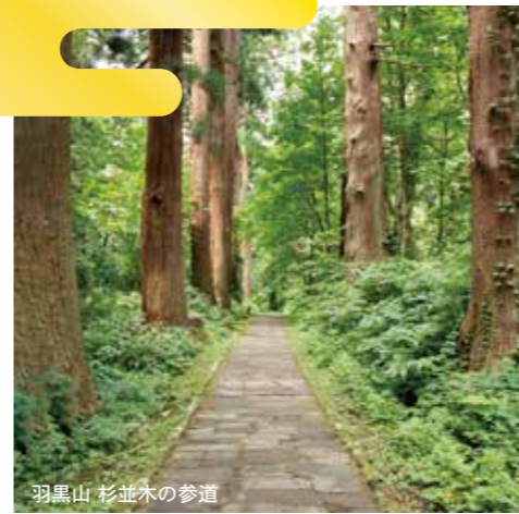
羽黒山 杉並木の参道